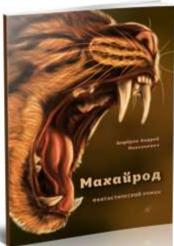
«Махайрод» Фантастический роман