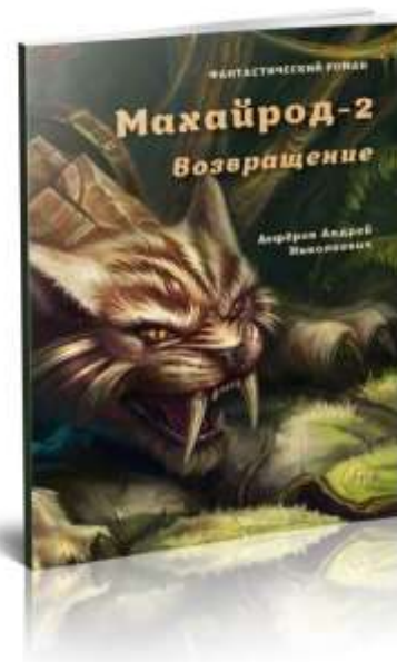
«Махайрод - 2» Возращение Фантастический роман